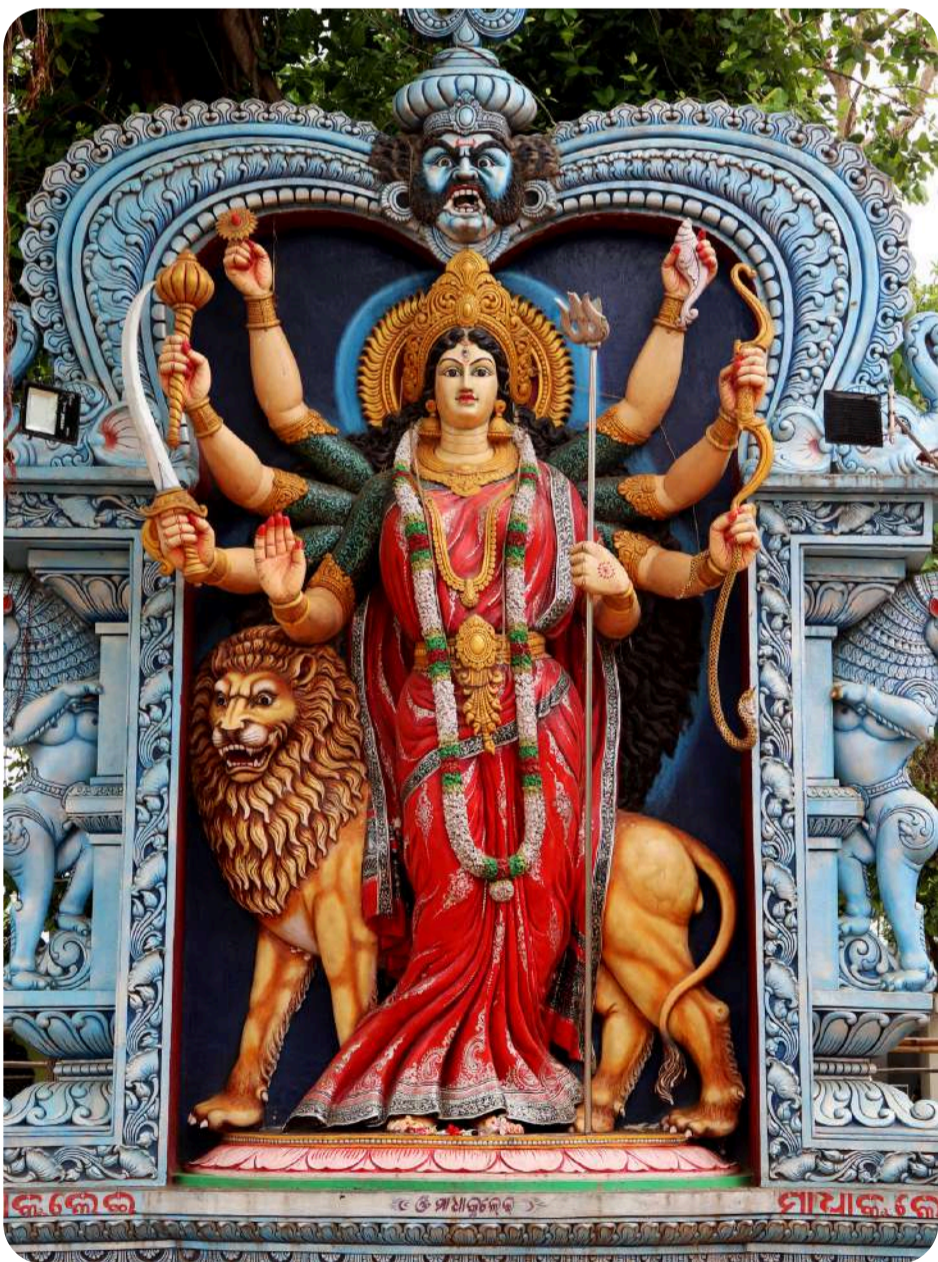
دیدن مراسم ادیان و مکان های مذهبی هند