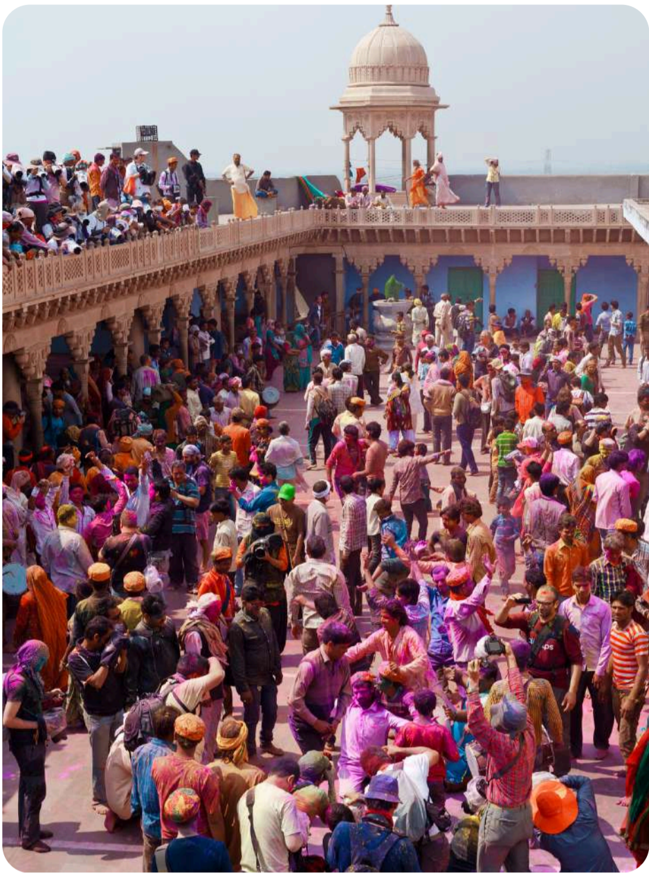
جشن رنگ هولی