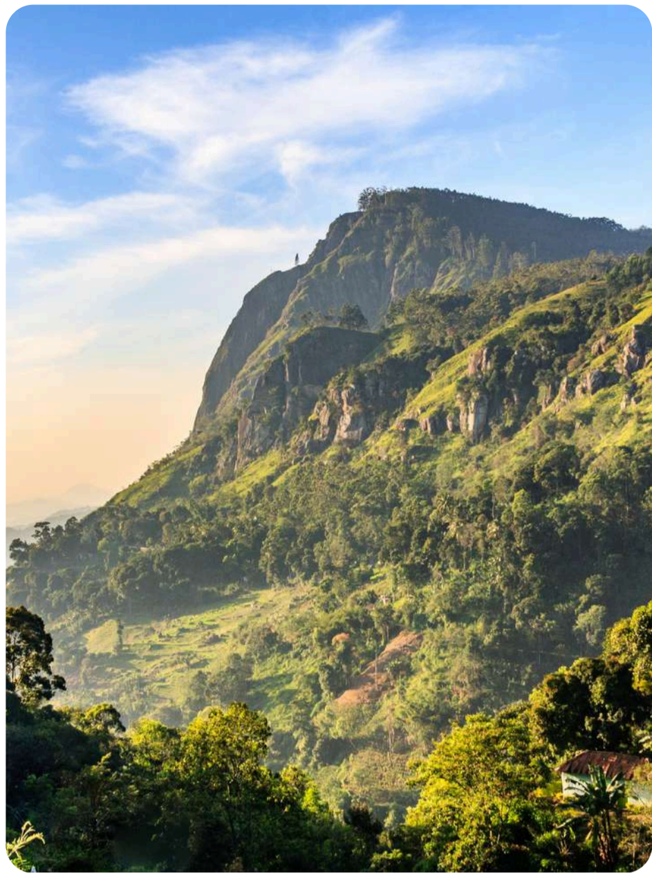
ویو Ella gap