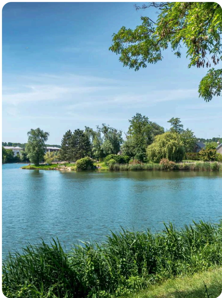
little Adam's peak